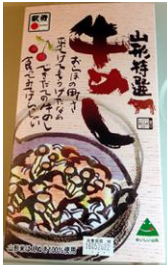
山形特選牛めし弁当 (往路: 東京駅購入)