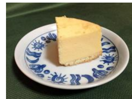
Monde Selection 金賞二回受賞『Cream Cheese Cake』