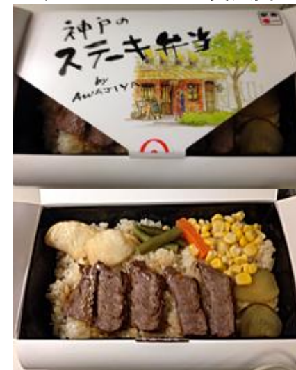
神戸のステーキ弁当 (復路: 新神戸駅購入)