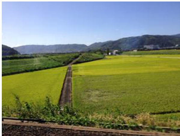
阪急電車の車窓から見た田園風景