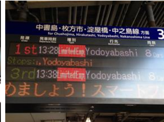
淀屋橋行き特急を示す 掲示版