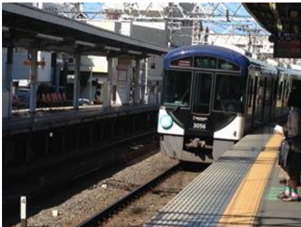
丹波橋駅で阪急電車一階建車両に乗り換え 京阪電車のレール幅も世界標準軌