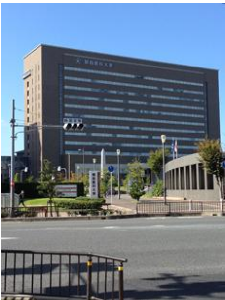
関西医科大学 枚方キャンパスビル