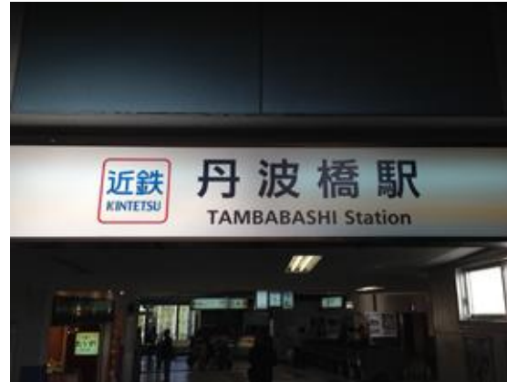
丹波橋駅で 近鉄から京阪電車に乗換え