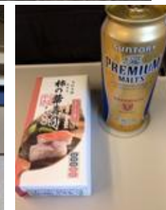
京都駅で柿の葉寿司とモルツを買い込んで新幹線に乗り込む