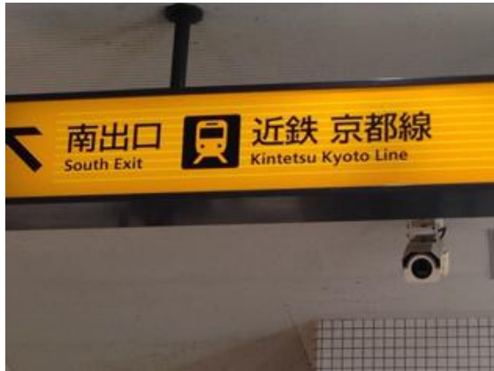
京都駅で 新幹線から近鉄奈良線に乗換え