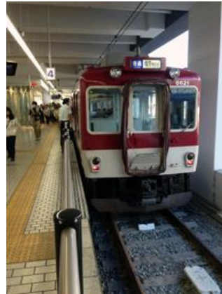
近鉄のレール幅は 世界標準軌