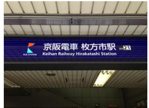
京阪電車枚方駅に到着