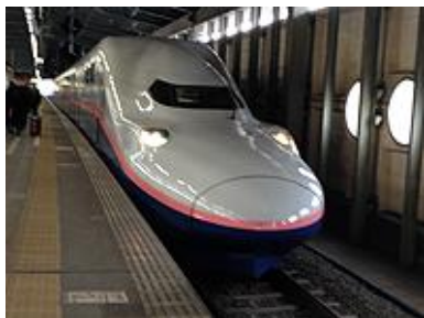
東京駅新潟行き Maxとき