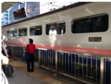
二階建て車両 Max はもうすぐ廃止予定