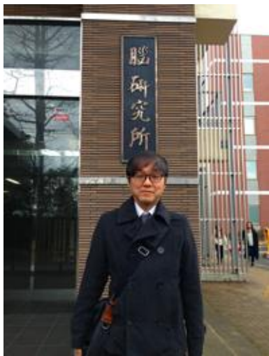
増井助教は初めて