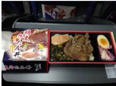
往路は牛タン明太子弁当 帰りは新潟駅の寿司屋さん