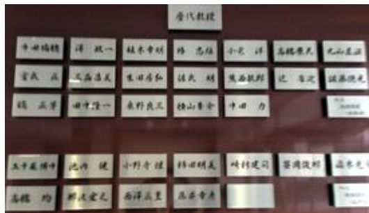
毎年恒例の新潟脳研出張で共同研究に関する意見・情報交換を行いました