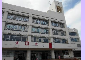
※昨年度の掲示の様子です