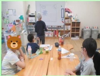
背景をどうするか話し合い。

2月に本校の体育館で行われる展覧会に展示する作品のひとつ。みんなの力が合わさり、大きな作品になりました。