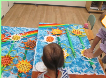
みんなで作った花を咲かせました。