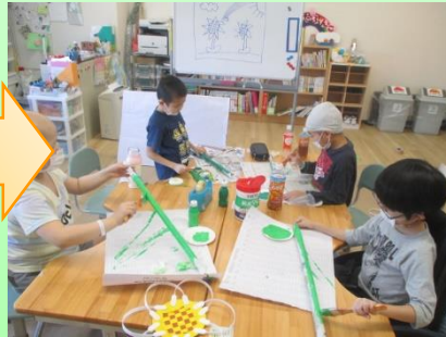
新聞紙を丸めて茎を作り…