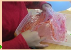
乾いたらはがして クルクルまいて～