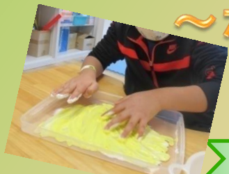
ボンドと絵の具を混ぜて～