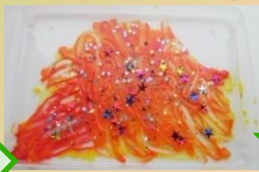
ビーズをちりばめて～