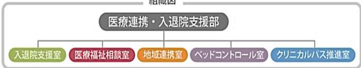
医療連携・入退院支援部 組織図