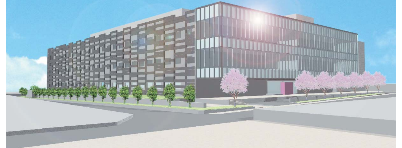
連携大学院完成予想図