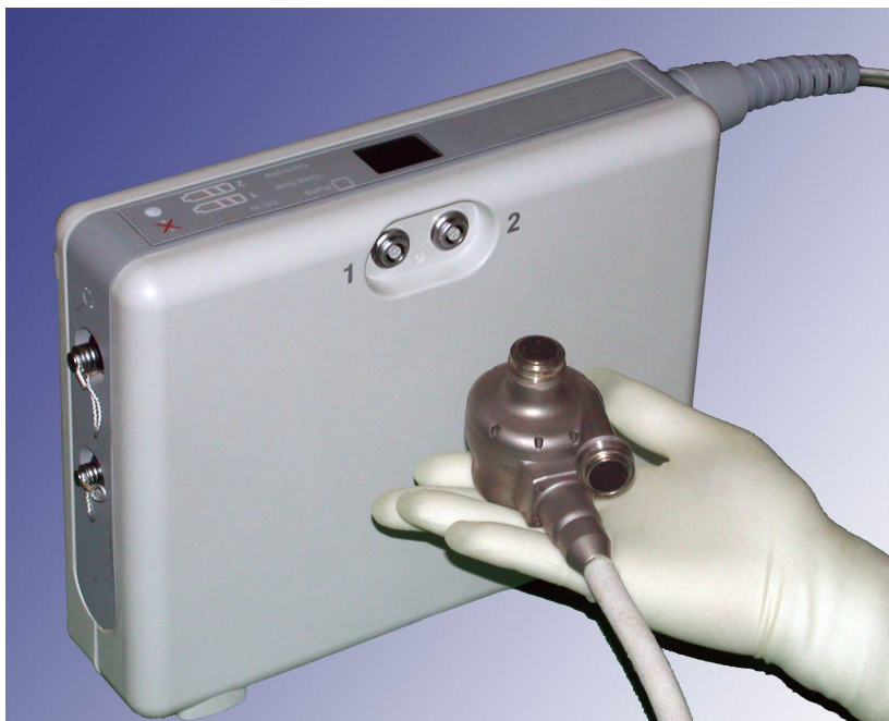
図 1 . 植込み型遠心ポンプ EVAHEART : 装置植込み患者さんは常時コントローラを携帯しなくてはならない制約があるものの、自宅における日常的な生活が可能となります。