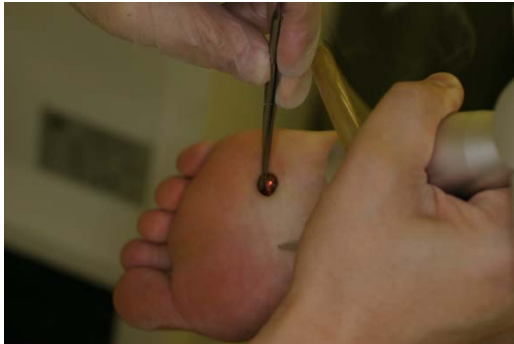
CO 2 レーザー照射