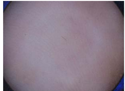
ダーモスコープによる 診断で治癒を確認