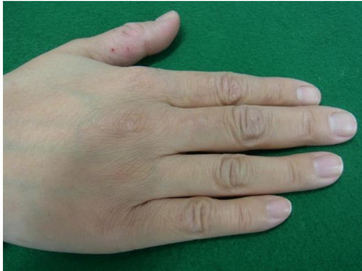
CO 2 レーザー照射 1 回の照射後 3 か月、再発なし。