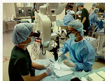
↑ 高校生の医師体験