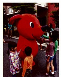
↑ ちーばクンも登場