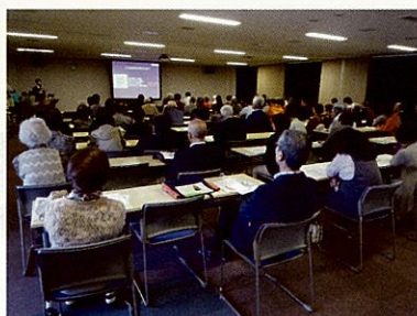
↑ 2011.10 健康フェスタ:健康セミナー