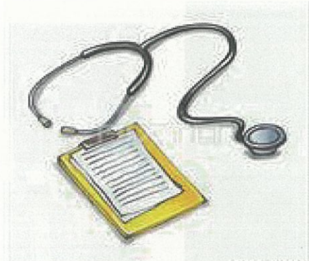
副院長(教育担当) 高梨 潤一