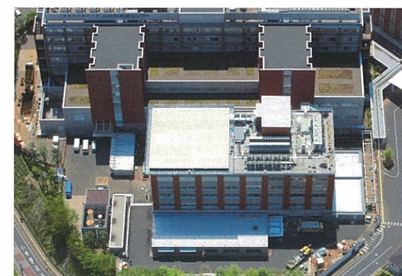
第2病棟外観(平成28年5月)